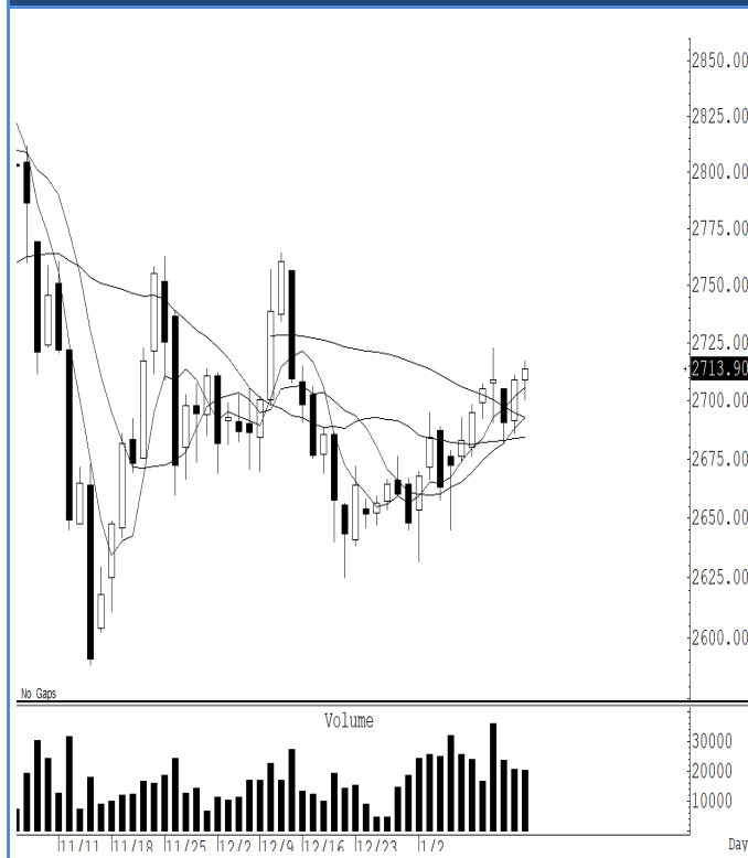
GOH25 (Close 2,713.90 Chg 4.70)

ราคาทองคำโลกแกว่งออกด้านข้าง เรายแนะนำยกการ์ดสูงหรือตั้ง stop ไว้ จาก ความผันผวนของราคาที่เราคาดว่าจะแกว่งแรง แนะนำ trading ในกรอบ 2,700- 2,720 ดอลลาร์ รับรู้กำไร ในกรณีที่ปิดต่ำกว่า 2,695 ดอลลาร์ แนะนำ ถือ short หวังผลปรับตัวลงไปแถว ๆ 2,650 ดอลลาร์ รับรู้กำไร เรายกกำหนดจุด stop สำหรับข้าง short ไว้ที่ 2,725 ดอลลาร์